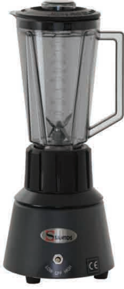
NO 33 GE