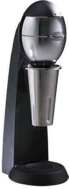
NO 54 N