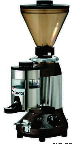
NO 06 A