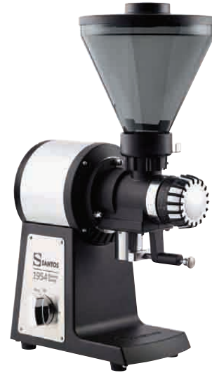
NO 01 BAR