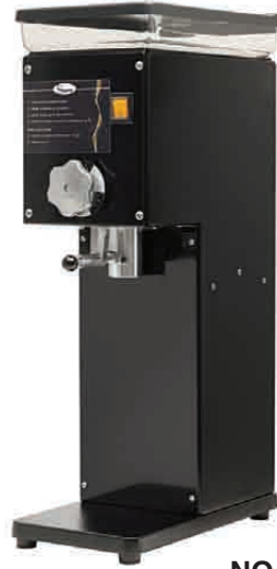
NO 43 N