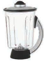
4P Polikarbon Hazne