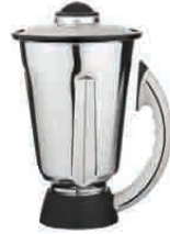
4l Paslanmaz Hazne