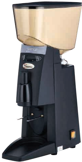
NO 55 BF - Ondemand